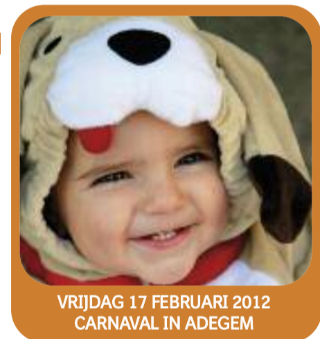
VRIJDAG 17 FEBRUARI 2012 CARNAVAL IN ADEGEM

Verkoop Valentijnskoekjes Waar: Vrije Basisschool De Papaver, Adegem-Dorp 16A, 9991 Adegem Meer info: Ouderraad De Papaver Adegem