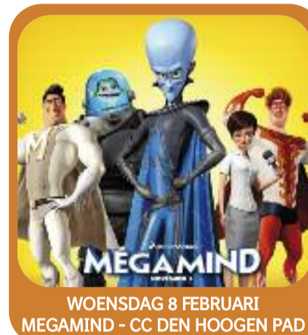
WOENSDAG 8 FEBRUARI MEGAMIND - CC DEN HOOGEN PAD

Bowlingnamiddag Neos Maldegem van 14:00 tot 17:00 Waar: Verzamelen aan zwembad, Gidsenlaan zn, 9990 Maldegem Meer info: +32 50 71 35 20, +32 50 78 80 81