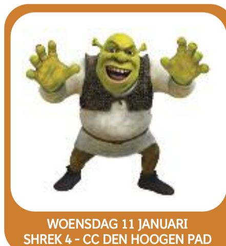
WOENSDAG 11 JANUARI SHREK 4 - CC DEN HOOGEN PAD