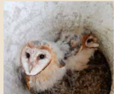
Beringd als jong in Biezeveld in juni 2016.