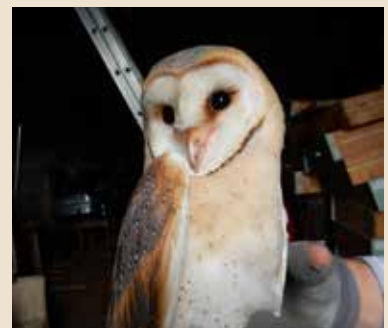
In de Warmestraat in september 2016.