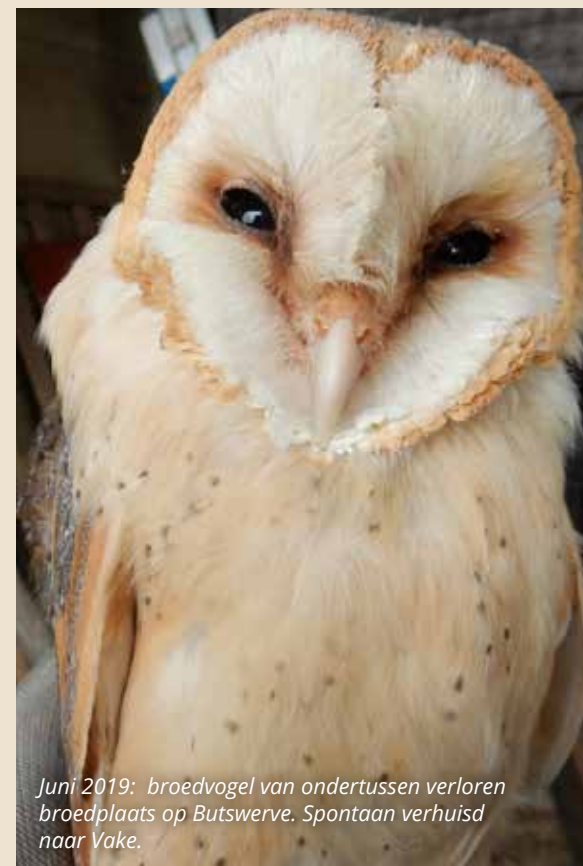
Juni 2019: broedvogel van ondertussen verloren broedplaats op Butswerve. Spontaan verhuisd naar Vake.