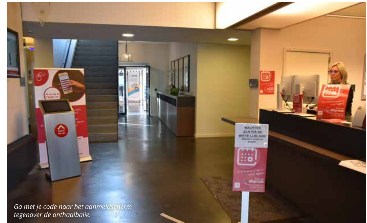
Ga met je code naar het aanmeldscherm tegenover de onthaalbalie.

Kom langs en meld je aan door je afspraakcode in te geven op het aanmeldscherm aan de onthaalbalie.