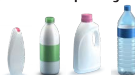
Plastic flessen en flacons